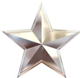
ZILVER (€ 750,-)

Dit is het iets uitgebreidere sponsorpakket met als voordeel dat u uw sponsorschap ook als klein marketinginstrument kunt gebruiken. Dit pakket heeft een minimale duur van twee seizoenen. Dit kunt u van ons verwachten: