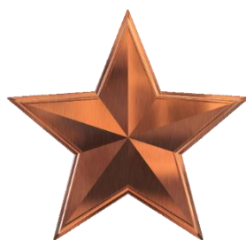
BRONS (€ 500,-)

Hieronder gaan we verder in op de pakketten, want wat kunt u nou concreet van ons verwachten?