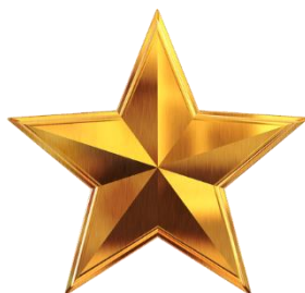
GOUD (€ 1.250,-)

Dit is ons meest uitgebreide sponsorpakket voor reguliere sponsoren. De duur is minimaal twee seizoenen. Wij bieden u bij dit pakket dan het volgende: